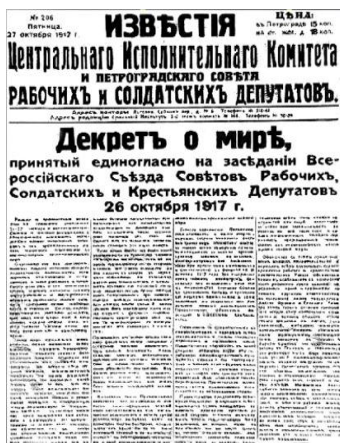
Декрет о мире