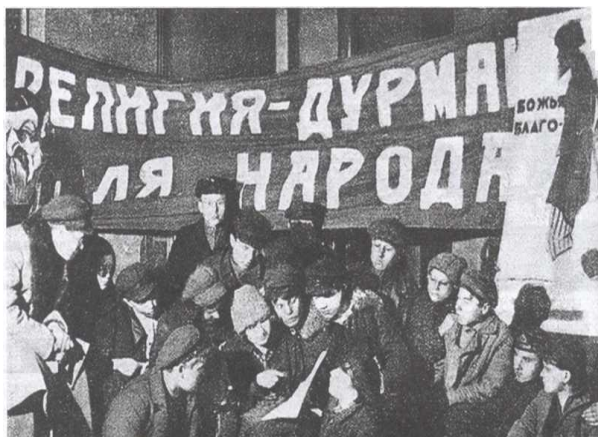
Комсомольская пасха в Москве

легитимизировал победу большевиков и их сторонников, приняв декрет об образовании рабочего и крестьянского правительства во главе с В.И. Лениным. Теперь, став правящей, РСДРП(б) более не могла кого-то упрекать, критиковать, обличать, она должна была действовать и выполнять свои обещания и лозунги, оправдывать идеи и призывы.