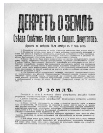
Декрет о земле

Политика большевиков в период становления Советской власти. Первые декреты [Электронный ресурс] // Кириллов В. Отечественная история: [конспект лекций] / В. Кириллов, Г. Кулагина. – Режим доступа: http://www.oldru.com/kulagina/75.htm . - Загл. с экрана. – (Дата обращения 01.06.2017).