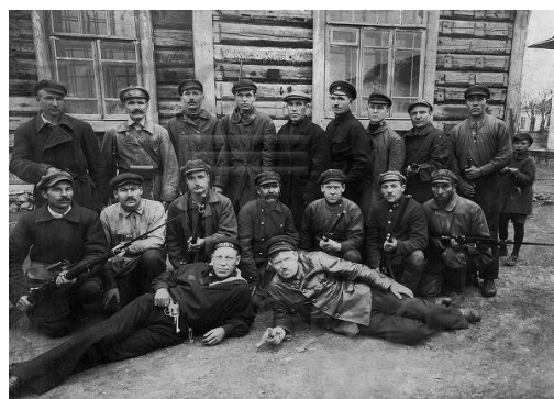
Участники Красной Гвардии 1917-1918 гг.

Революция, как это было на самом деле... (воспоминания участника событий. Москва, 8-15 ноября) часть 1. Воспоминания Сергея Эфрона «Октябрь (1917)», о боях в Москве 26 октября (8 ноября) - 2 (15) ноября [Электронный ресурс]. – Режим доступа: https://cont.ws/@sage/222481 (Дата обращения 02.06.2017)