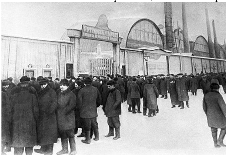
Бастующие рабочие у ворот Путиловского завода во время стачки, январь 1905 года

Есть ли в истории сослагательное наклонение? Есть, но обращаться с ним нужно очень аккуратно. Эта тема существовала и в советской историографии как проблема субъективного фактора, как альтернативы в истории – в этих терминах проблема вполне уважаема. Что бы случилось, если бы Ленин не доехал до России в апреле 1917 года? Как говорил Троцкий, этот вопрос легче поставить, чем на него ответить. Похожий вопрос можно задать и относительно самого Троцкого, и относительно тех политических деятелей, которые не дожили до 1917 года. Так есть ли фатализм социальных факторов, который привел нас в ту же точку, или этого фатализма нет, а есть набор разных исторических альтернатив? Я признаю, что социальные тенденции крайне сильны, что нужен их тщательный анализ. Каковы основные развилки, болевые точки революции?