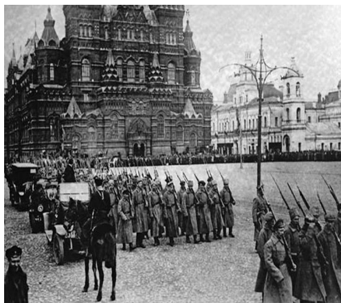
Октябрь, 1917 г.