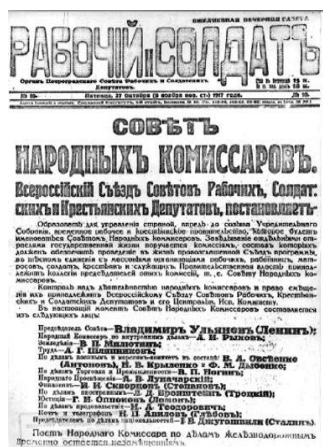
Декрет о власти