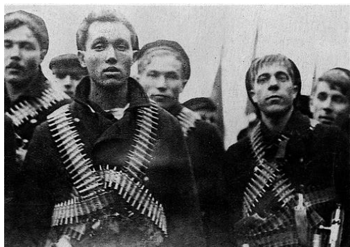
Революционные матросы, обмотанные пулеметными лентами

В августе еврейка Каплан стреляла в Ленина и ранила его. Через несколько дней был убит чекист Урицкий. Тогда большевики, чтобы запугать население, арестовали массу офицеров. Предварительно они приказали всем офицерам регистрироваться. Более дальновидные не регистрировались. Менее дальновидные, в том числе и я, зарегистрировались. Мой брат, председатель Гвардейского экономического общества, был арестован. Всех арестованных офицеров отводили в районный совдеп. Брат, сидя там со множеством офицеров и видя, что красноармейцы постоянно входят туда и выходят, воспользовавшись беспорядком в совдепе, смешался с выходящими красноармейцами и вышел на улицу. В тот же день уехал в город Владимир, чтобы его не нашли. Все другие офицеры, в числе 562, были вывезены в Кронштадт и там расстреляны. Это был красный террор. Еврей Каннегисер убил Урицкого, а расплачивались совершенно аполитичные офицеры. Это имело свои последствия, так как расправа с офицерами вызвала массовое их бегство на окраины России, где они организовали добровольческие армии, которые в течение трех лет вели жестокую гражданскую войну с большевиками.