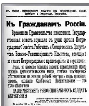
Объявление ВРК о низложении Временного правительства

Исторические оценки Октября 1917 г. [Электронный ресурс] // Кириллов В. Отечественная история: [конспект лекций] / В. Кириллов, Г. Кулагина. – Режим доступа: http://www.oldru.com/kulagina/74.htm . - Загл. с экрана. – (Дата обращения 01.06.2017).